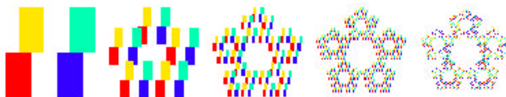
Fig. 1: Un document initial comporte 4 rectangles (image de gauche). On le copie avec un photocopieur possédant 5 systèmes optiques. On compte sur la copie 4 \cdot 5 rectangles. Si on photocopie la copie on obtient 4 \cdot 5 \cdot 5 = 4 \cdot 5^2 rectangles. Après plusieurs passages, l'image obtenue ne se modifie plus.

Imaginez un photocopieur un peu particulier: au lieu d'un seul système optique, il en possède plusieurs. Chaque jeu de lentilles produit une image réduite du document original. La copie comporte alors autant d'images réduites que le photocopieur possède de systèmes optiques. Si vous photocopiez la copie, puis la copie de la copie, ... vous finirez par obtenir une image qui ne se modifie plus. Et, plus étonnant encore, cette image finale est la même quelle que soit celle figurant sur l'original! Cette image finale s'appelle «l'attracteur» du photocopieur.