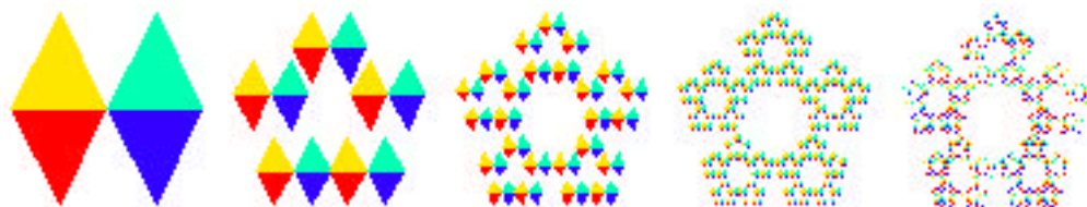
Fig. 2: L'image finale, appelée « attracteur », est indépendante de l'image initiale. L'attracteur est atteint lorsque la résolution du photocopieur ne permet plus de distinguer une copie de la suivante.

Les images obtenues peuvent être étirées ou rétrécies. Elles peuvent subir des rotations et des rabattements. Mais, au cours de ces transformations, les lignes droites restent des lignes droites et les parallèles demeurent parallèles. En termes mathématiques, chaque système optique du photocopieur effectue une transformation affine du plan. Pour qu'un photocopieur – quel que soit le nombre de ses systèmes optiques – possède un attracteur et que celui-ci soit unique, il suffit que chaque système de lentilles produise une image réduite de l'image initiale.