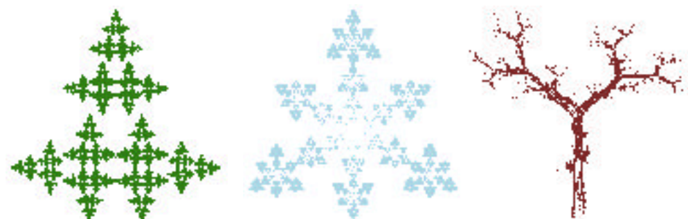
Fig. 3: Attracteurs de photocopieurs à 3, 4 et 5 systèmes optiques, respectivement de gauche à droite.

Les images obtenues peuvent être étirées ou rétrécies. Elles peuvent subir des rotations et des rabattements. Mais, au cours de ces transformations, les lignes droites restent des lignes droites et les parallèles demeurent parallèles. En termes mathématiques, chaque système optique du photocopieur effectue une transformation affine du plan. Pour qu'un photocopieur – quel que soit le nombre de ses systèmes optiques – possède un attracteur et que celui-ci soit unique, il suffit que chaque système de lentilles produise une image réduite de l'image initiale.