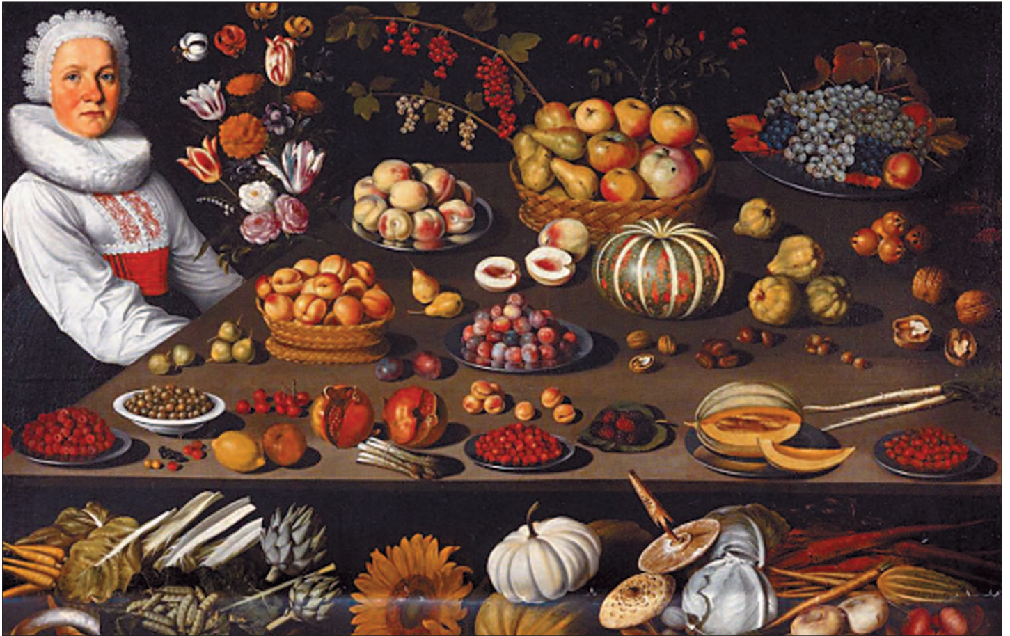
Sur les tableaux du XVII e siècle, comme celui-ci du peintre bernois Albrecht Kauw, les légumes pouvant servir à préparer une soupe apparaissent: carottes, pois, navets et autres racines, radis blancs, courges, bettes, choux, salsifis, oignons.

les champignons que l'on trouve pourtant dans les paquets de massepains. Mais aussi les courgettes, haricots frais, poivrons, petits pois frais, aubergines, tous des légumes d'été. De même, la pomme de terre de garde est difficile à trouver, car Genève cultive principalement des pommes de terre nouvelles récoltées à fin septembre.